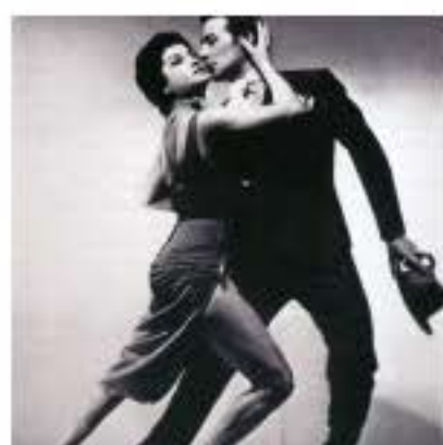
El ultimo Tango