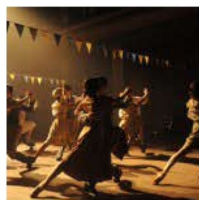
El ultimo Tango