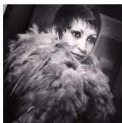
El ultimo Tango