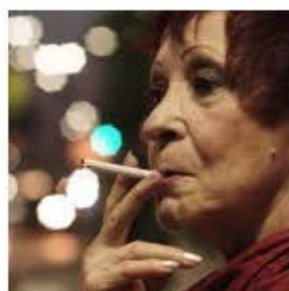
El ultimo Tango